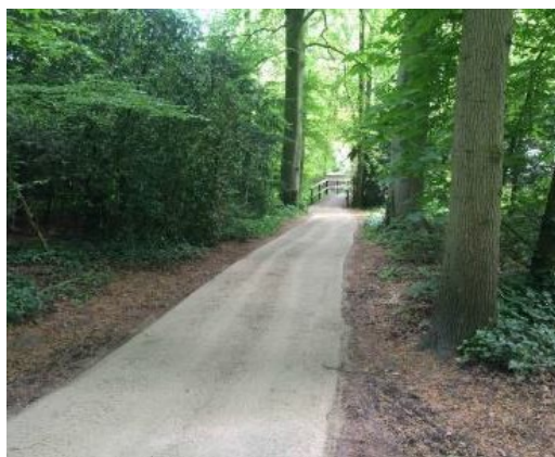
Afbeelding 2 – fietspad met 'halfverharding' als materialisatie